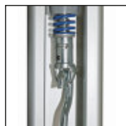
Netz entspannt – Feder sichtbar