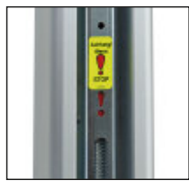
Anzeige bei Erreichen des maximalen Spannweges.