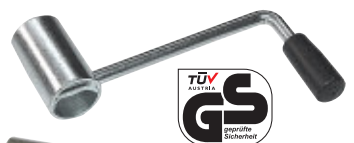
Ersatzkurbel ab Bj. 2012