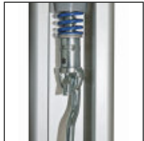
Netz entspannt – Feder sichtbar