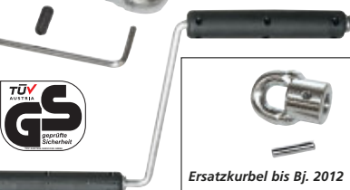
Ersatzkurbel bis Bj. 2012